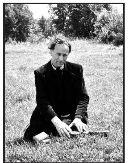
Jonas Mekas Semeniškiuose, 1977 m.