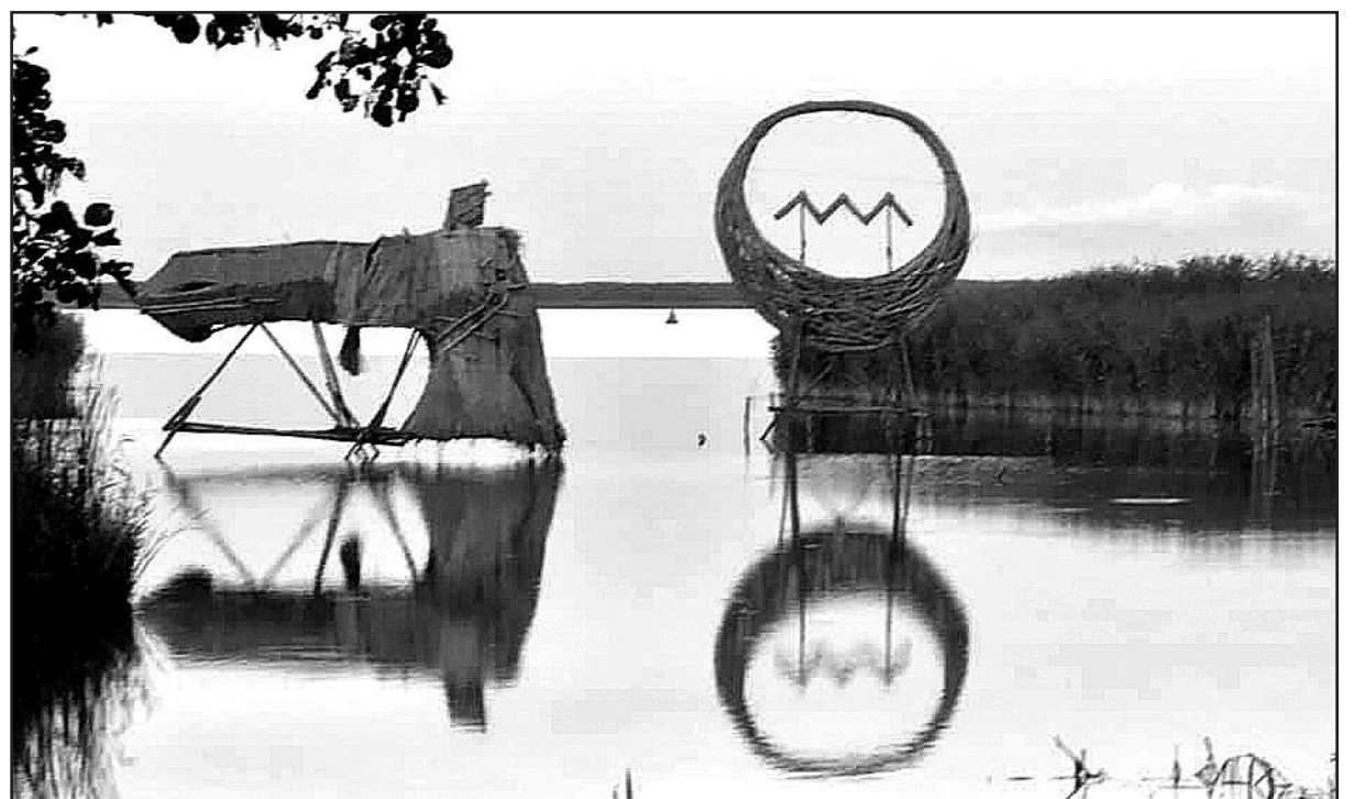
Vaizdas į Gintaro įlanką Juodkrantėje.