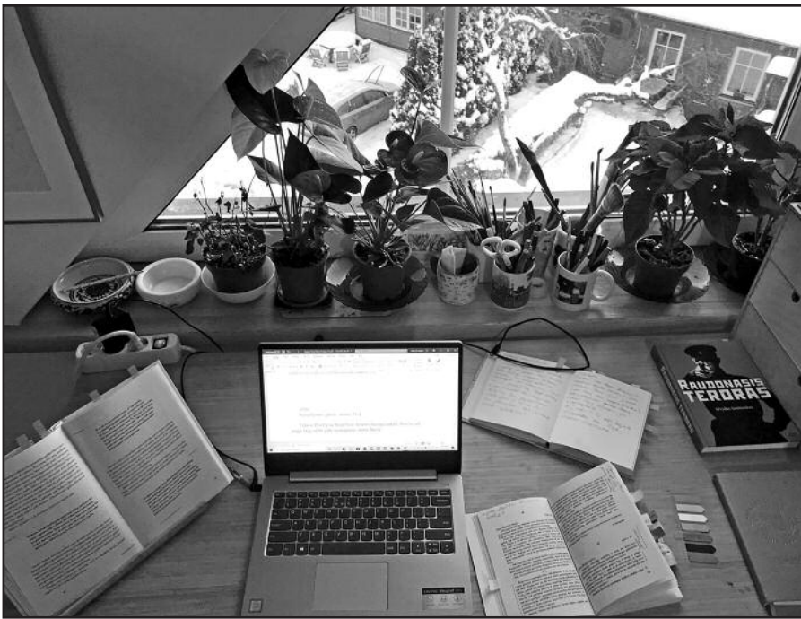
Čia gimsta naujos knygos.

išmintį – perimi iš to autoriaus. Tarsi to žmogaus balsas kurį laiką gyvena tavėje.